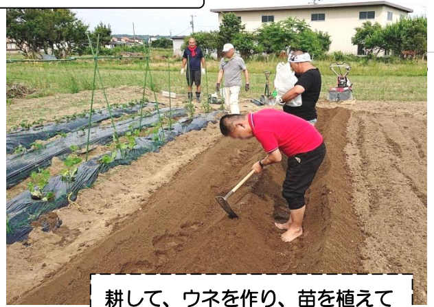
耕して、ウネを作り、苗を植えて