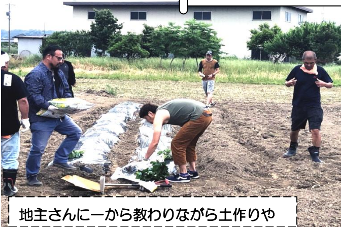
地主さんに一から教わりながら土作りや