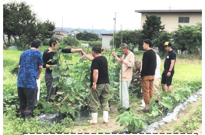
楽しみながら、みんなで頑張ってます！