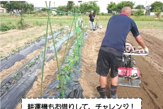
耕運機もお借りして、チャレンジ！