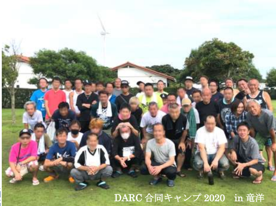
DARC 合同キャンプ 2020 in 竜洋