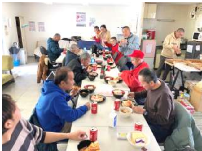
みんなでクリスマスのお祝い ごちそうをいただきました！