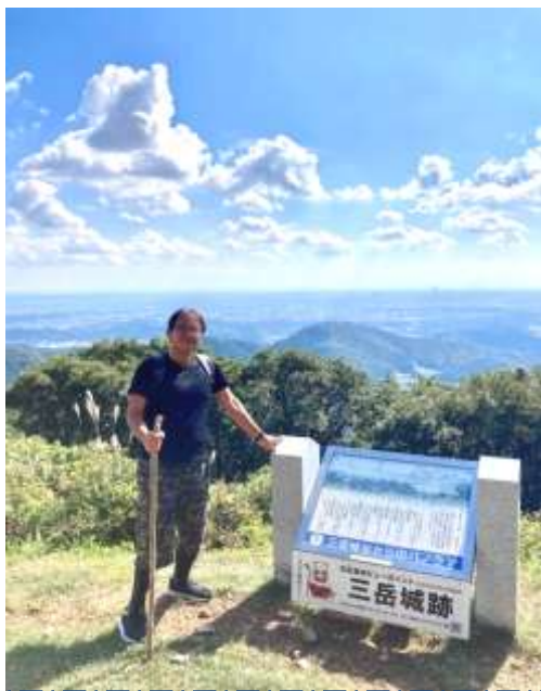
三岳山、みんなと頂上まで登れました！やったー！