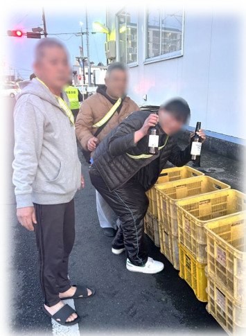
自治会ボランティア活動