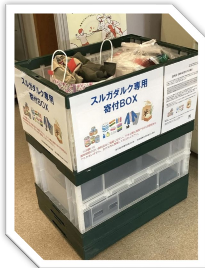
富士北地区まちづくり協議会様から 寄付 BOX 設置いただきました。