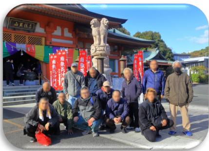
浜松初詣（遠州信貴山別院）