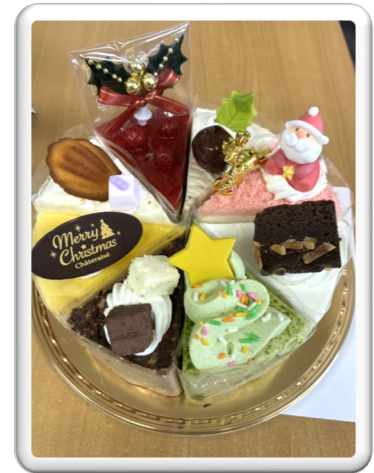
カトリック静岡教会様から Xmas cake 頂きました。