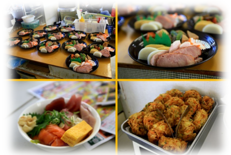
年末年始のお料理