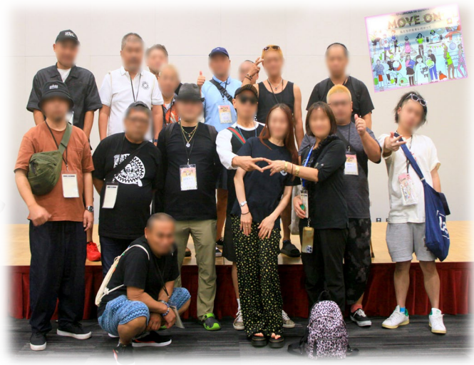
JRC NA in 群馬